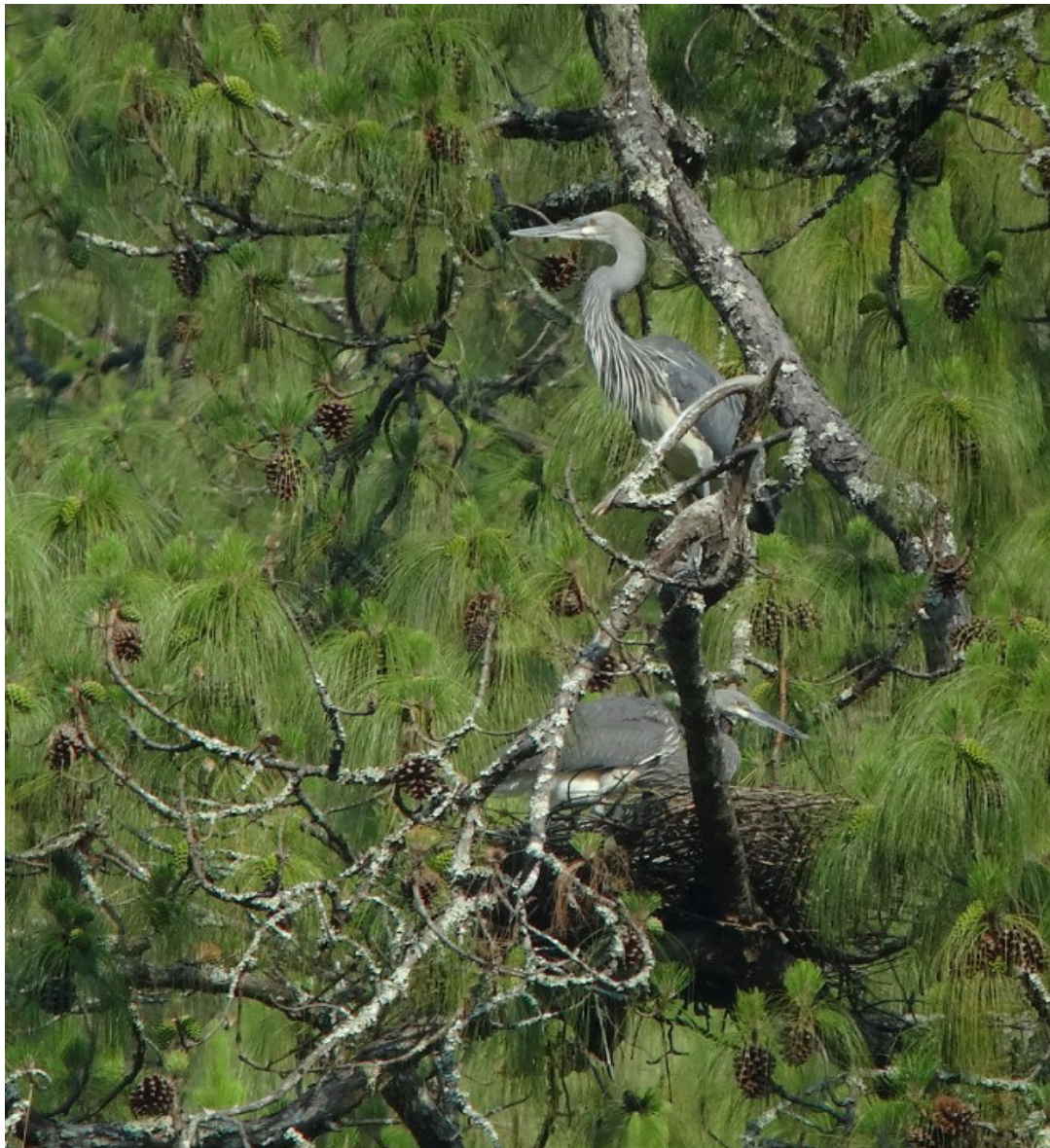
Kaiserreiher ( Ardea insignis )