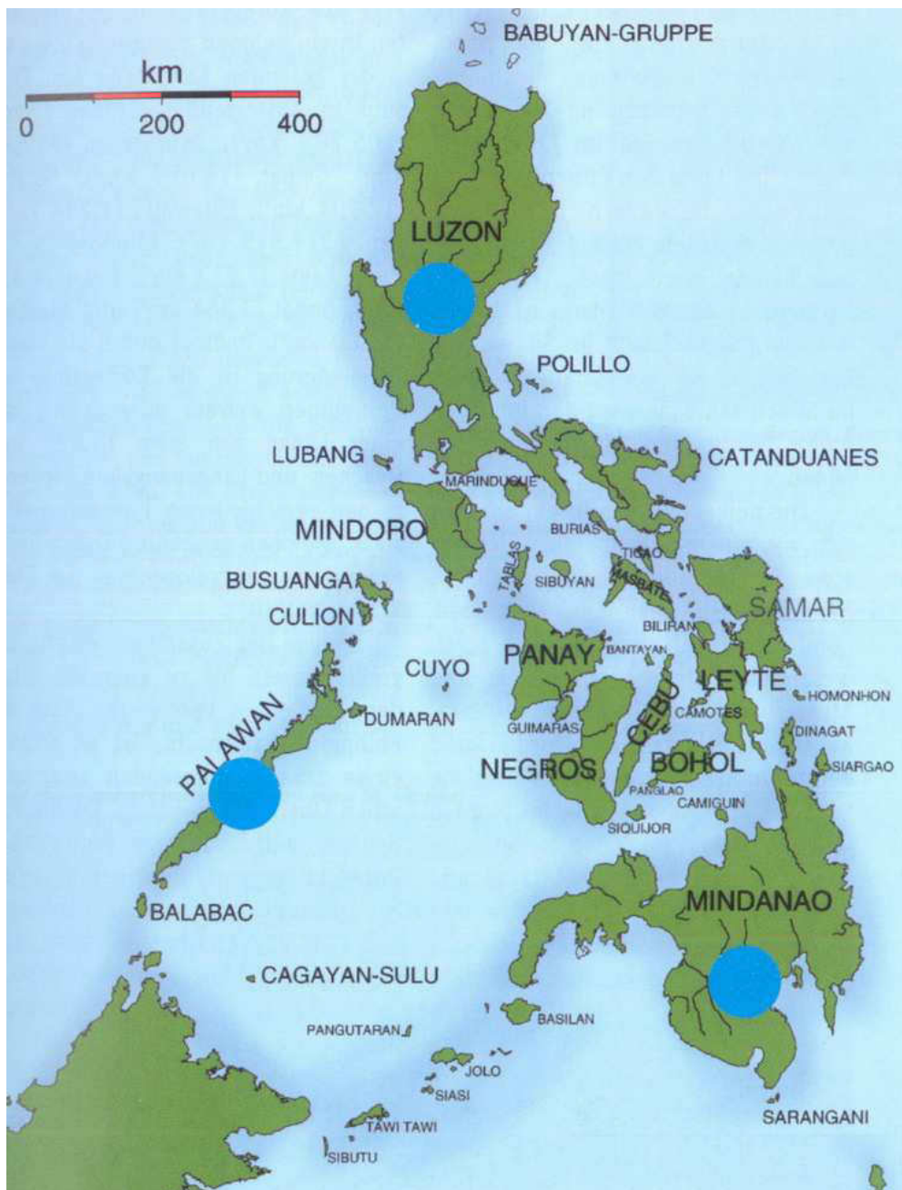
Besuch der Inseln Luzon, Mindanao und Palawan.