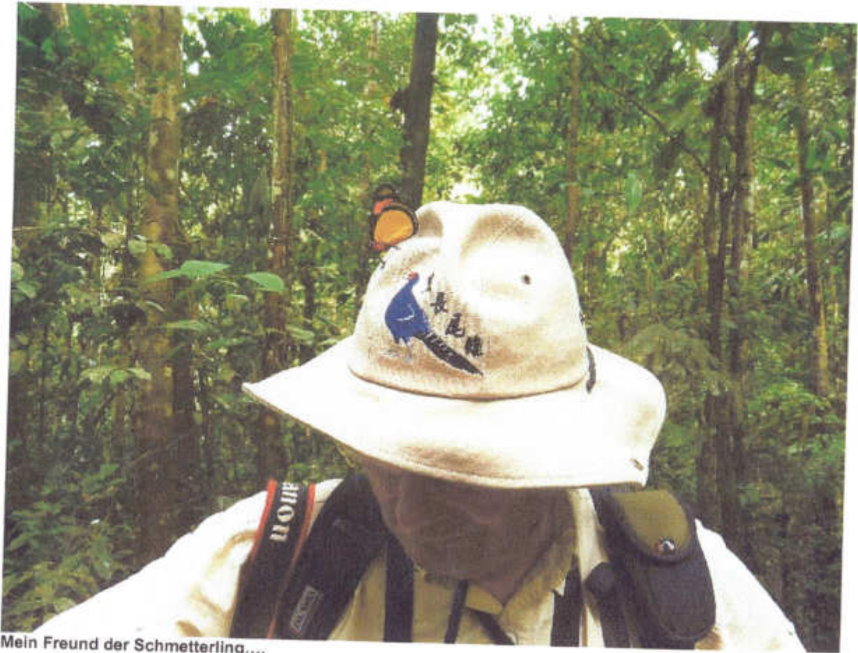
Mein Freund der Schmetterling....