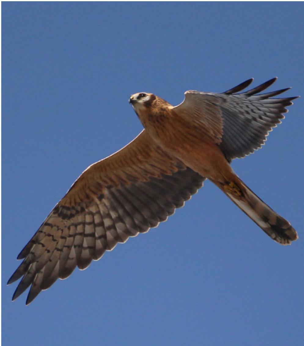
Wiesenweihe ( Circus pygargus )